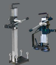
Chân đế máy khoan BST 90

35840 + 8, 10, 12, 14, 16, 18, 20, 22, 25 mm